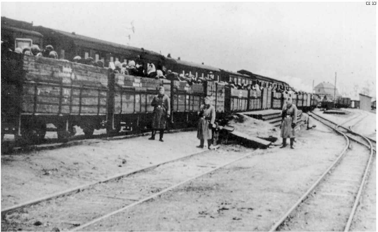
Żydzi w wagonach kolejki wąskotorowej w drodze do obozu zagłady w Chełmnie.