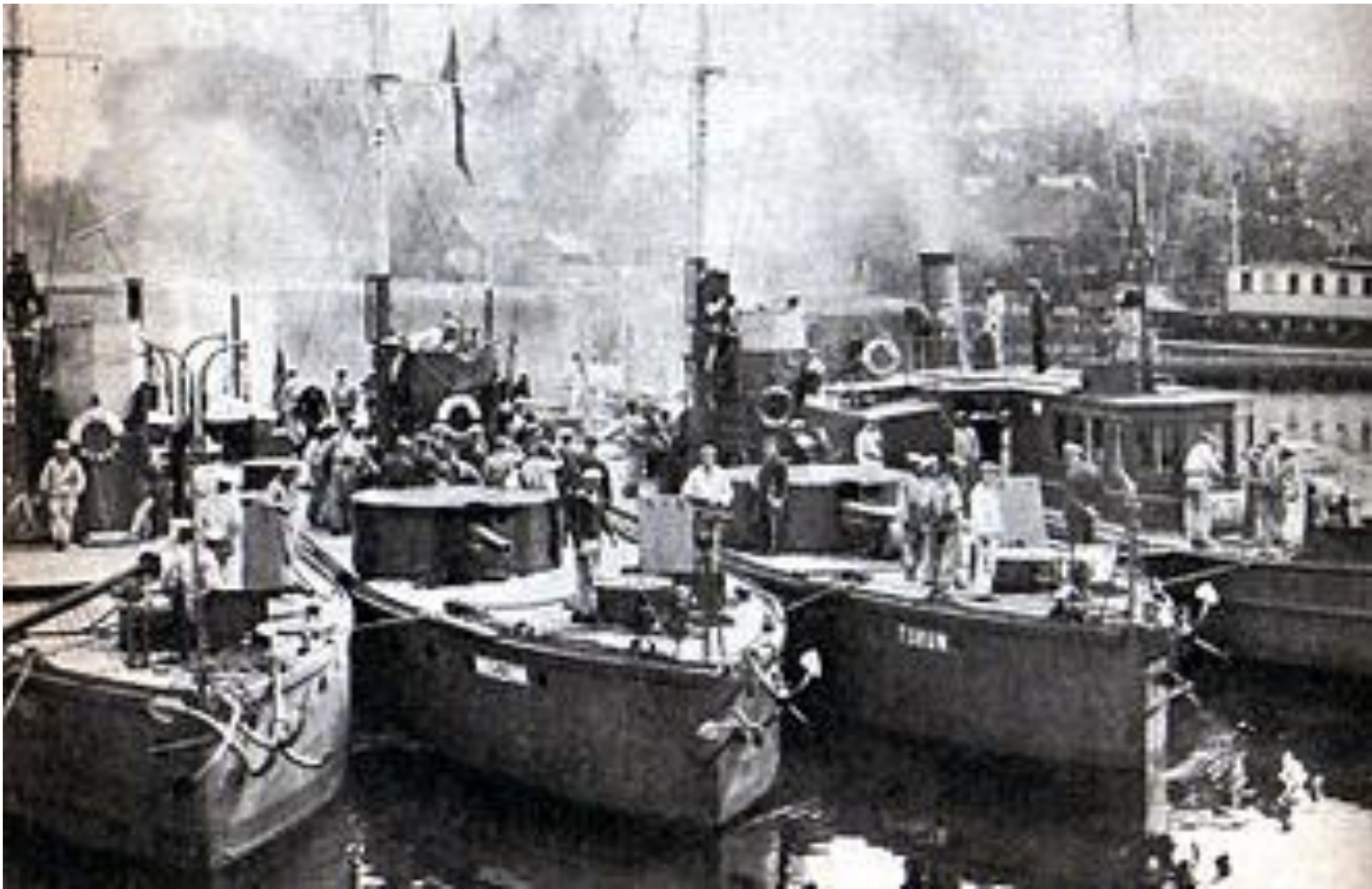
Monitory w Pińsku.