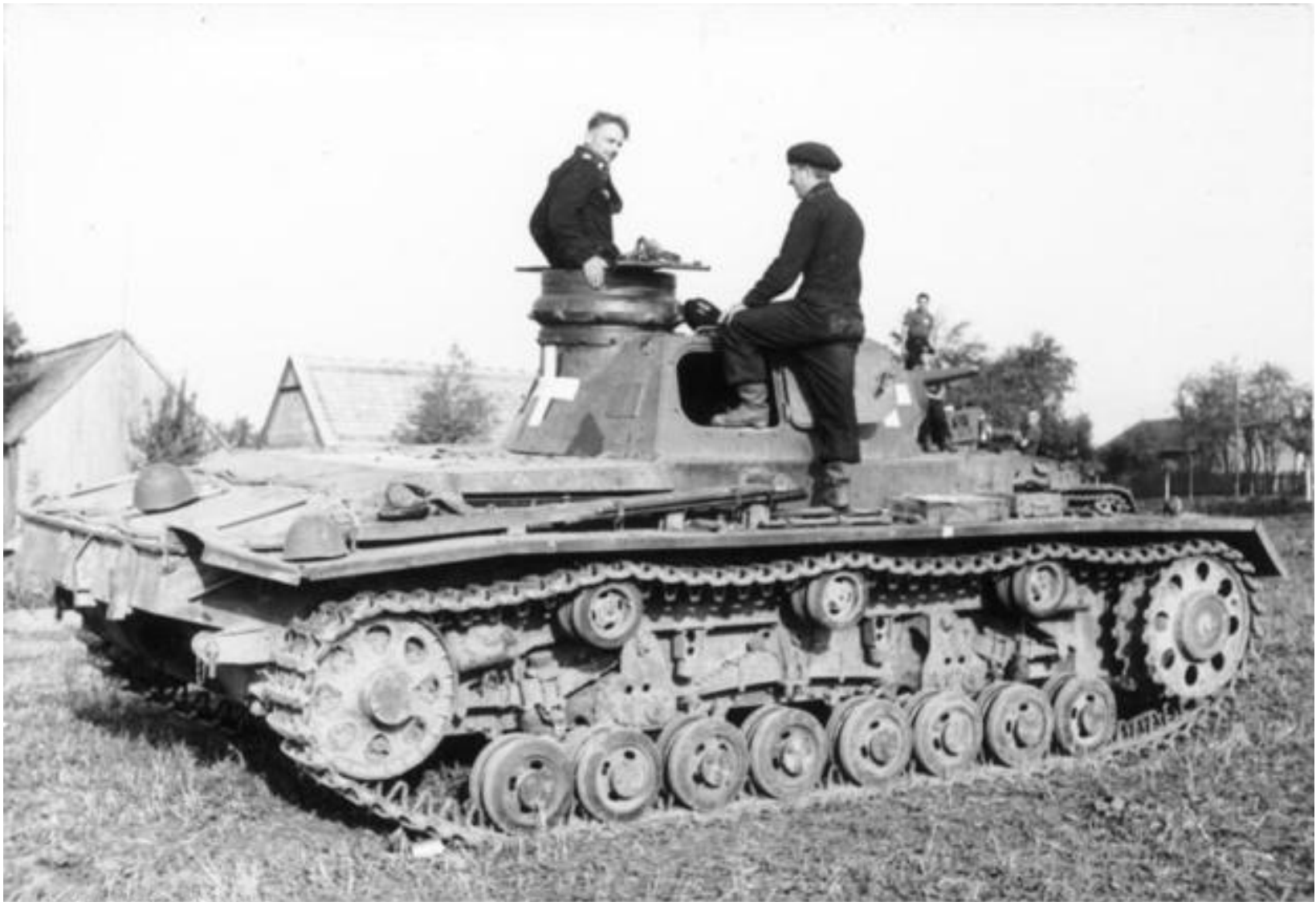
September 1939

Czołg PzKpfw III w Polsce we wrześniu 1939 roku. Dobrze widoczne białe krzyże, które malowano jedynie w Polsce.