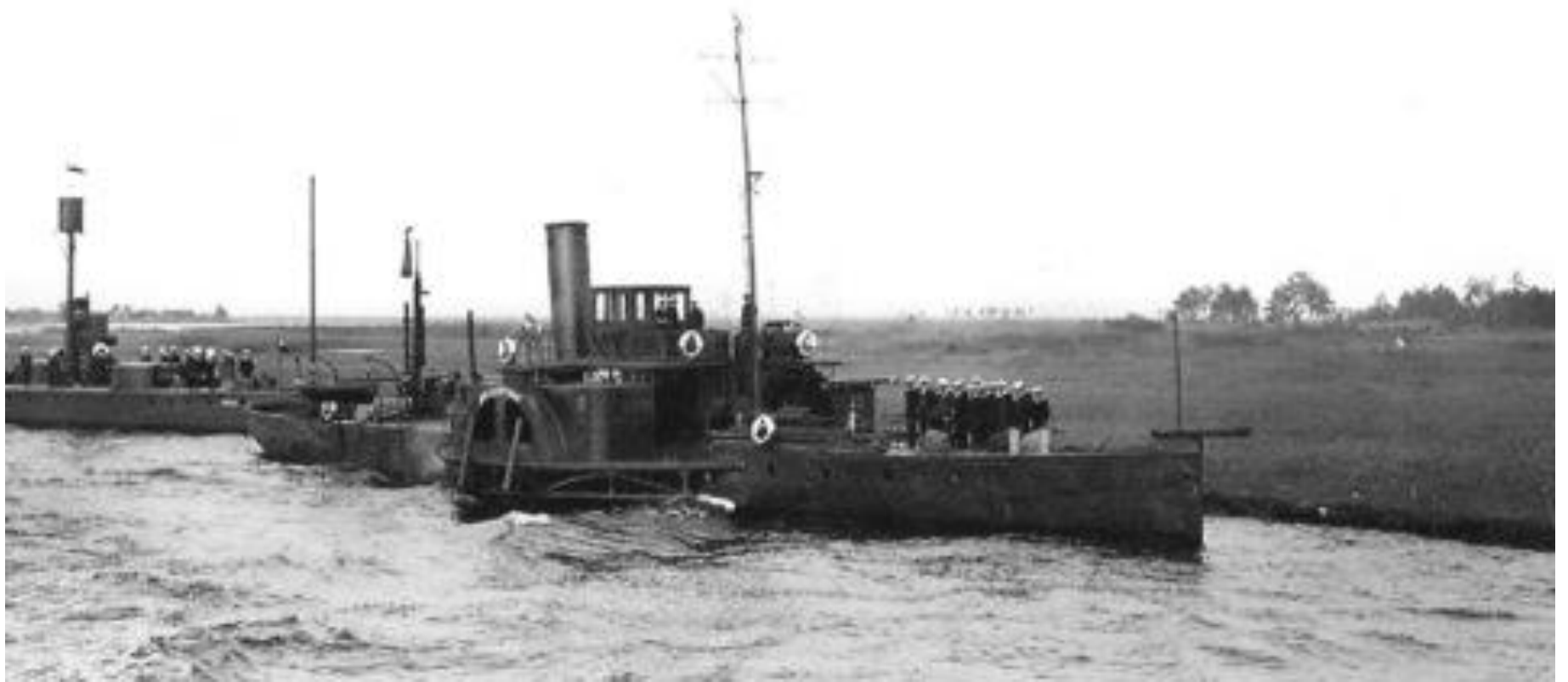
Okrety Flotyli na Pinie .