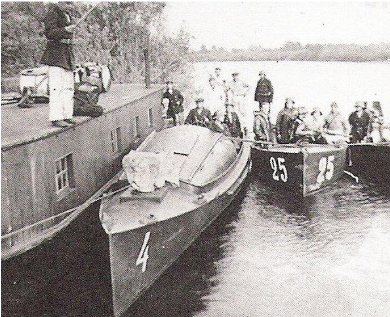
KU-4 w czasie służby przed wojną.