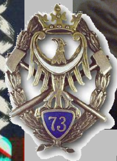
mjr Władysław Nawrocki.