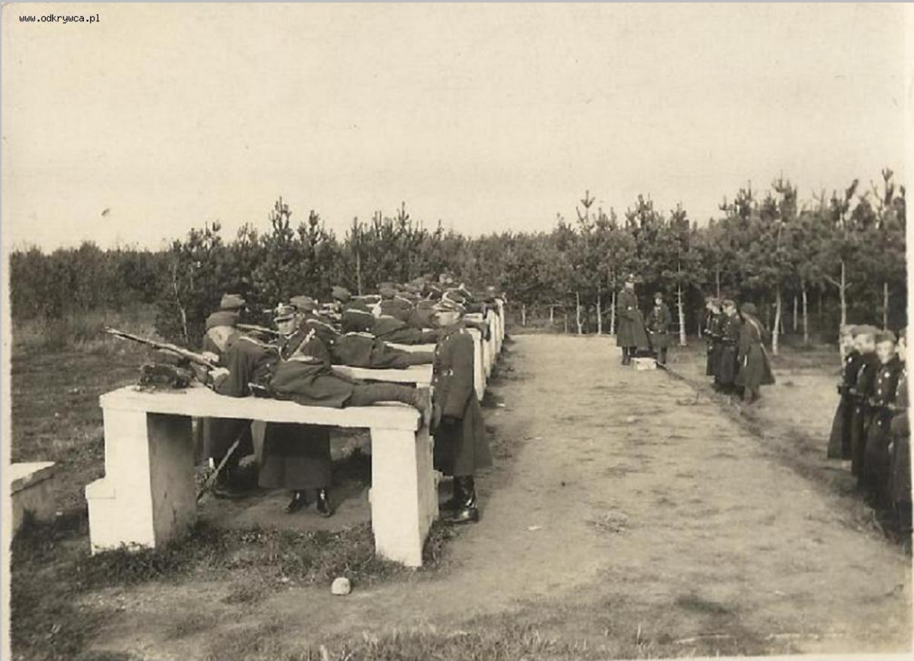
"73 PP - strzelnica w miejscowości Kochłowice"