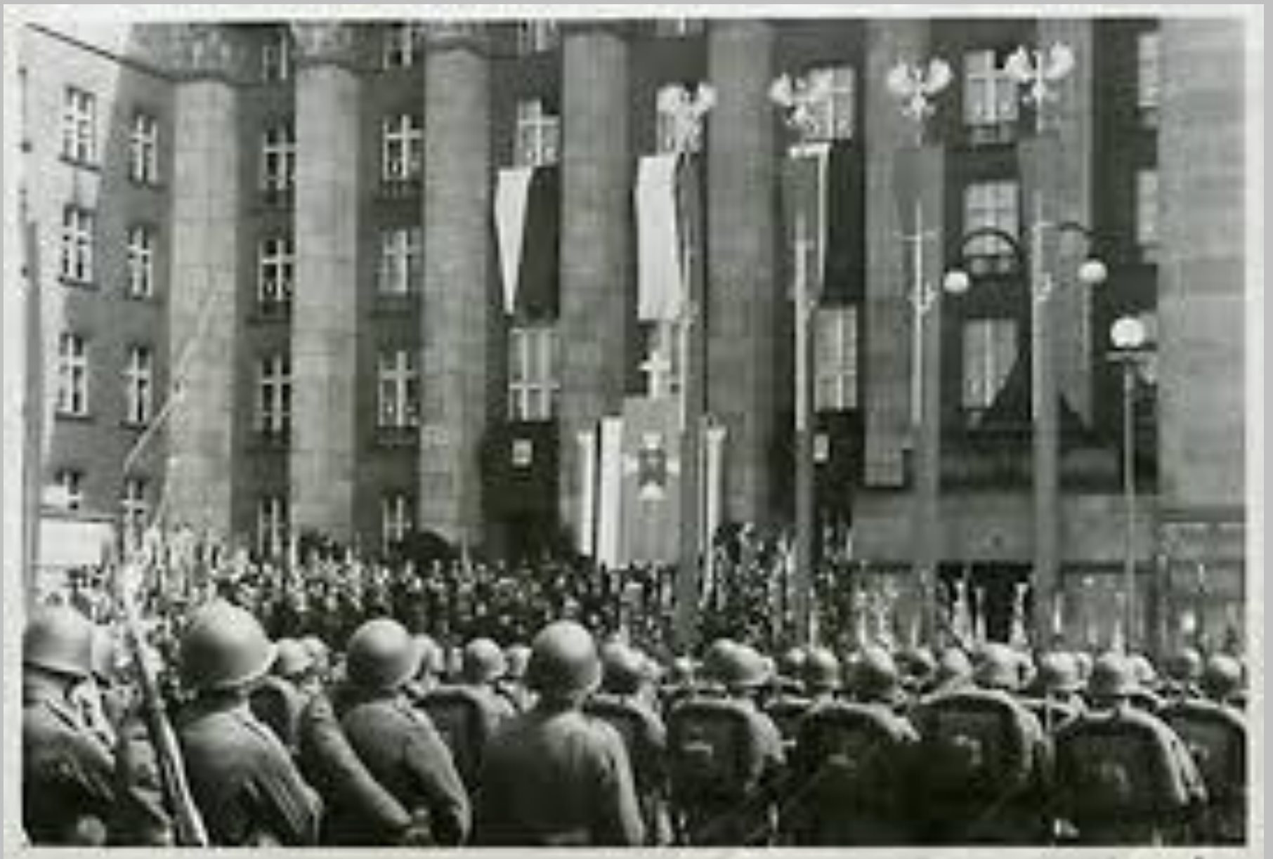
73 pp przed gmachem Sejmu Śląskiego.