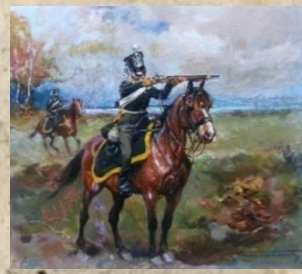
Strzelec 3 Pułku Strzelców Konnych