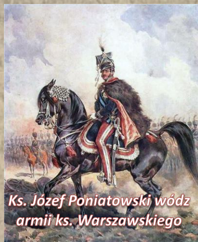
Ks. Józef Poniatowski wódz armii ks. Warszawskiego