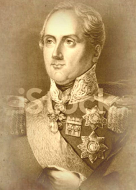
Fryderyk August I król Saksonii i ks. Warszawski

Księstwo Warszawskie - istniejące w latach 1807–1815, formalnie wolne, w rzeczywistości terytorium zależne podporządkowane Cesarstwu Francuskiemu i jego władcy, cesarzowi Francuzów Napoleonowi Bonaparte. Polityczna namiastka państwa polskiego. Władcą suwerennym Księstwa Warszawskiego był król Królestwa Saksonii Fryderyk August I.