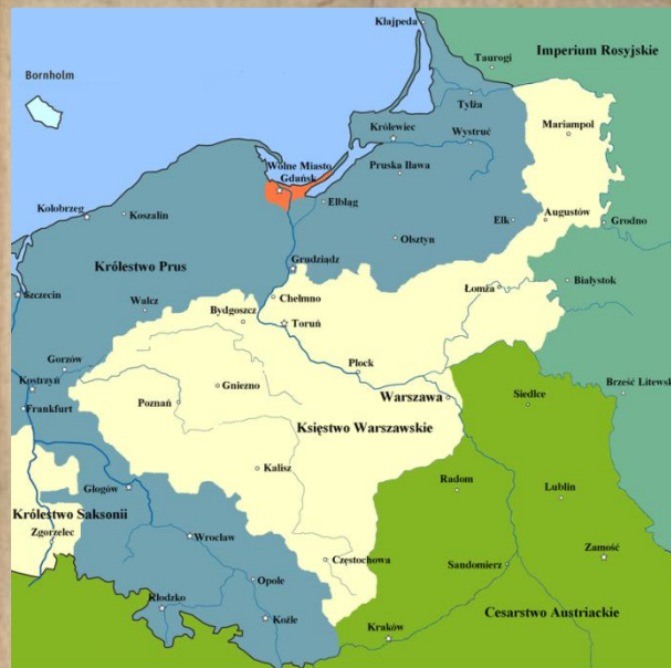
Księstwo Warszawskie w latach 1807–1809