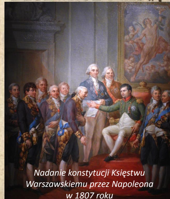
Nadanie konstytucji Księstwu Warszawskiemu przez Napoleona w 1807 roku